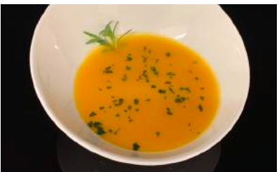
11022 CREMA DE CALABAZA