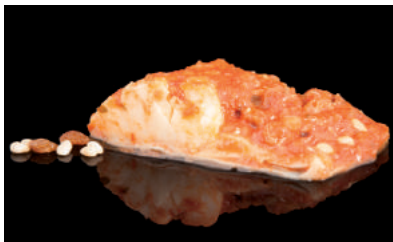
29022 BACALAO CON TOMATE, PÍÑONES Y PASAS